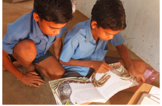
सरकारी स्कूल के बच्चे बलेंगापारा स्थित इमली महुआ की लाइब्रेरी में

समुदाय के लिए अभी तक किया सबसे महत्वपूर्ण कार्य है लाइब्रेरी की सुविधा को सरकारी स्कूल के बच्चों को उपलब्ध कराना. जब पता लगा की सरकारी स्कूल के बच्चों के लिए सुबह के समय आना संभव नहीं होगा तो फिर लाइब्रेरी के समय को दोपहर का किया गया. साथ-साथ इमली महुआ स्कूल के बच्चों ने घर-घर जाकर सरकारी स्कूल के छात्रों को लाइब्रेरी में आने के लिए प्रोत्साहित किया.